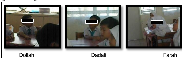
Rajah 1: Penglibatan aktif murid-murid

Penggunaan Warna dan Simbo (W&S) telah membantu murid saya dalam kemahiran menyambung huruf Jawi dengan betul. Selain itu, perhatian murid tertumpu kepada aktiviti yang dijalankan oeh saya. Melalui (W&S) ini saya telah memupuk minat mereka untuk melibatkan diri di dalam aktiviti yang dirancang oleh saya. Rajah 1 menunjukkan murid-murid saya melibatkan diri secara aktif dalam aktiviti yang dirancang.